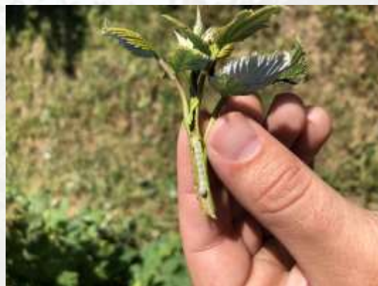
Larve de Hartigia trimaculata retrouvée dans une tige de plant de framboises. Que sait-on sur ce ravageur nouvellement retrouvé dans notre région?