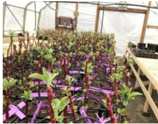
Expérimentation d'un producteur d'ici, des greffes sur table en serre!

Membre Agropomme..... gratuit Non membre Agropomme ..... 15.00 $