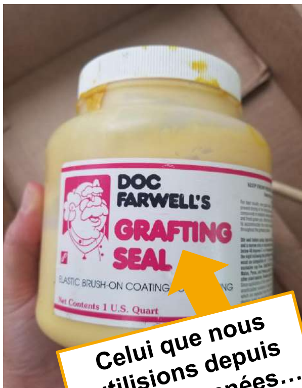
1. Doc Farwell's