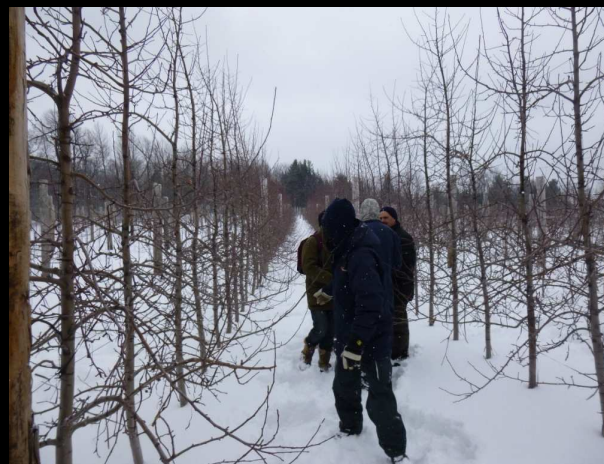
Honeycrisp/ bud 54118