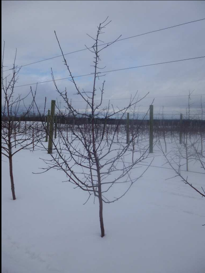
Mcintosh/cepiland (greffe sur table 2007)