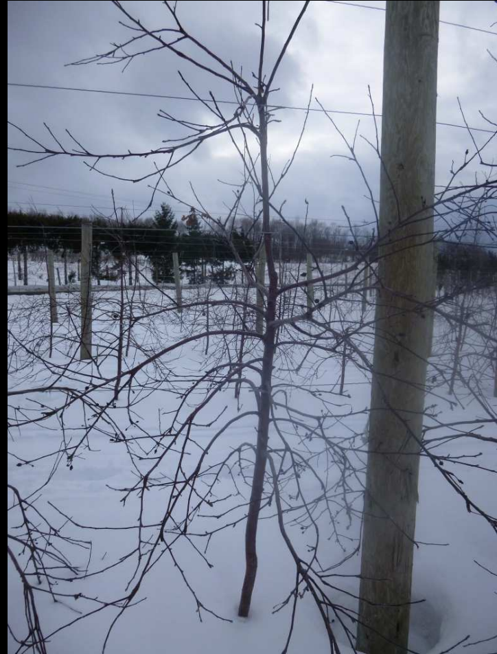
Royalcourt/cepiland (greffe sur table 2007)