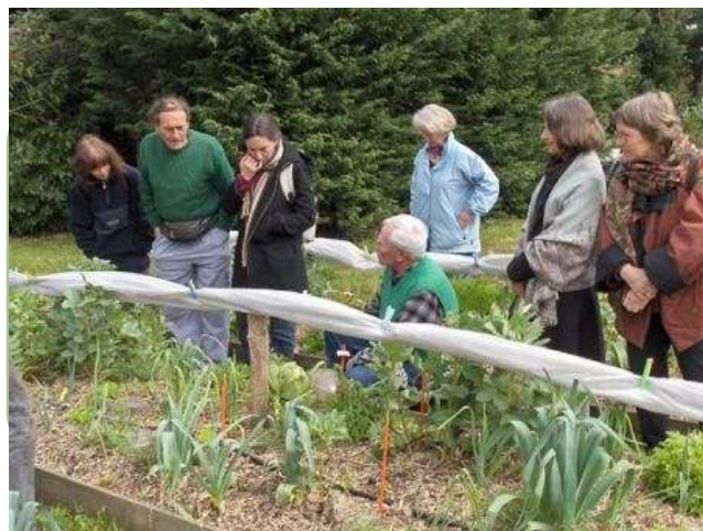
L'auteur en compagnie de visiteurs....