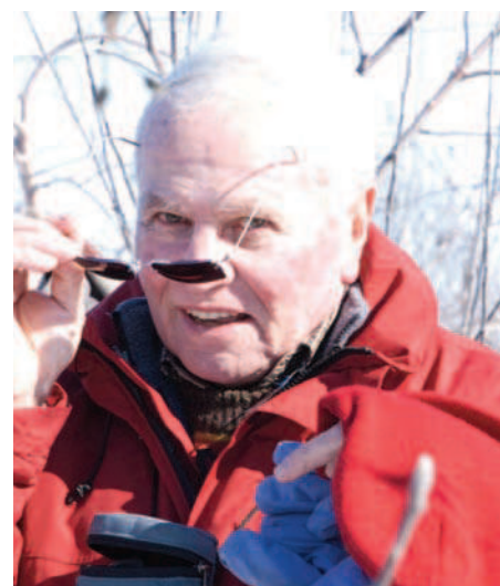
À l'origine, c'est Jean-Marie Lespinasse, de l'INRA (Bordeaux, France), qui fournissait le matériel génétique de la collection variétale plantée en 1986.

Bien que ces tableaux ne soient réalisés que depuis 2003, et que l'évaluation du goût peut paraître subjective, ils fournissent des indices essentiels pour le choix des sujets en création variétale. Les notes sont donc attribuées à la suite de données d'observation et de mesures qui sont consignées avec toute la rigueur scientifique qui s'impose.