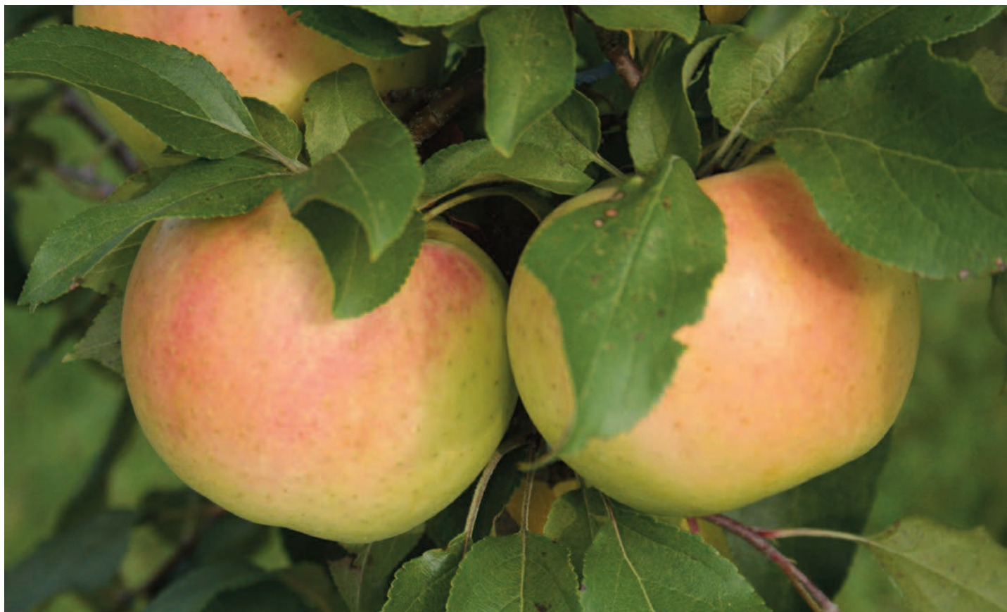
Des résultats, telle cette Q-370, sont prometteurs pour notre pomiculture de demain et proviennent de l'initiative exemplaire des individus, des hommes d'affaires de La Pomme de Demain.